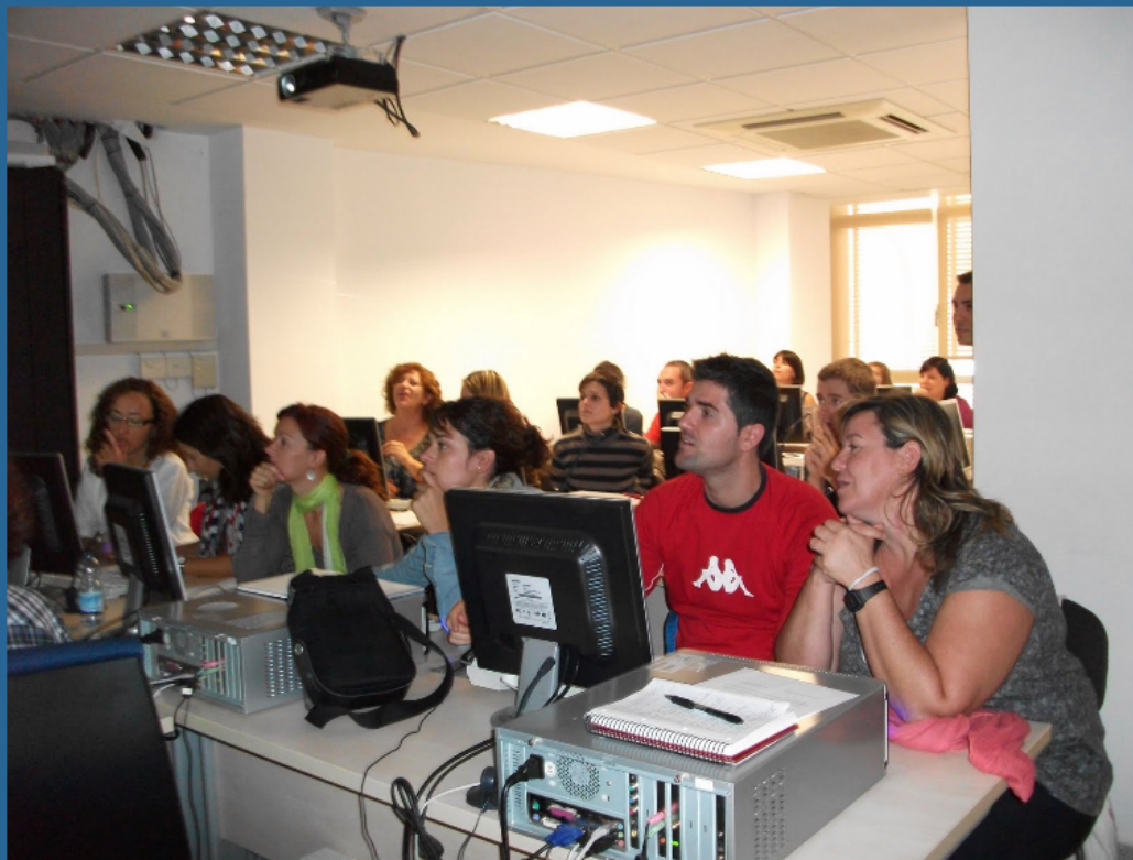
Seminari "De l'Aula d'acollida a l'Aula ordinària"