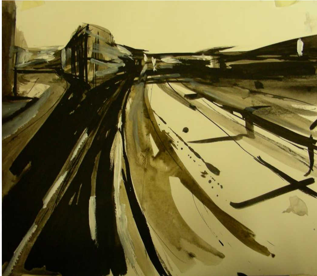
Francisco Javier Peinado Huertas: "Málaga Suite VI"